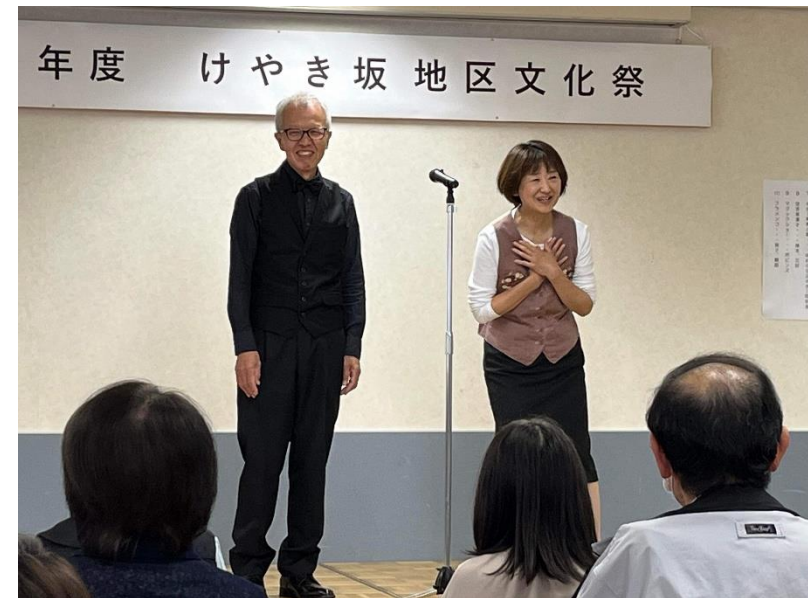
写真9.ナビゲーターの空き家漫才