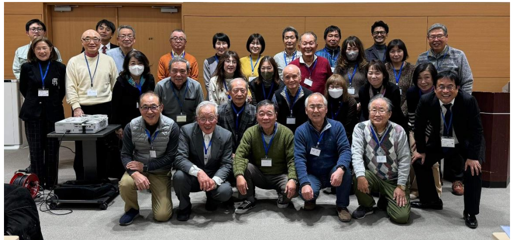
写真4.養成講座の修了式