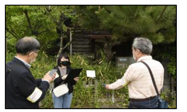
アプリを使用した空き家調査