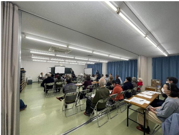
写真5.自治会でのセミナー

参加者約25名を5班に分け、空き家調査の判別方法から効率的な空き家調査の回り方、また川西市の空き家調査アプリを使用しての空き家調査デモを実施