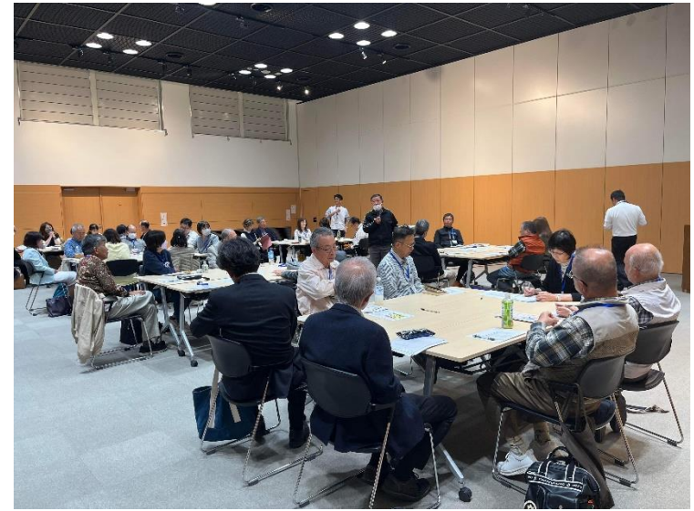
写真2.養成講座の開講式