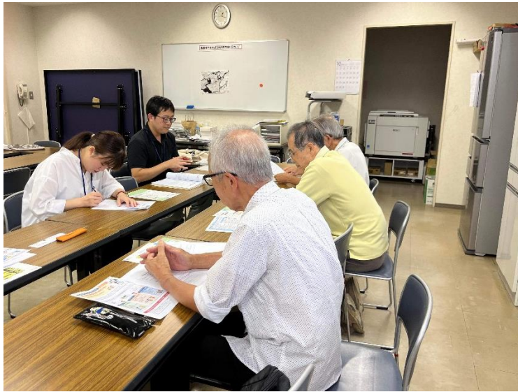
写真1.自治会役員との募集要項説明会