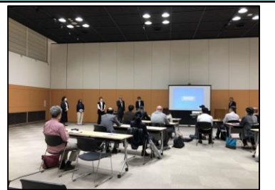
空き家対策ナビゲーター養成講座