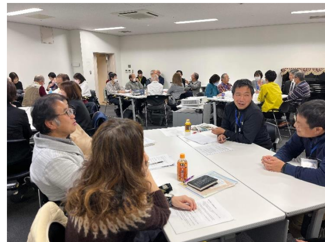
写真8.行政、専門家向け現地調査会