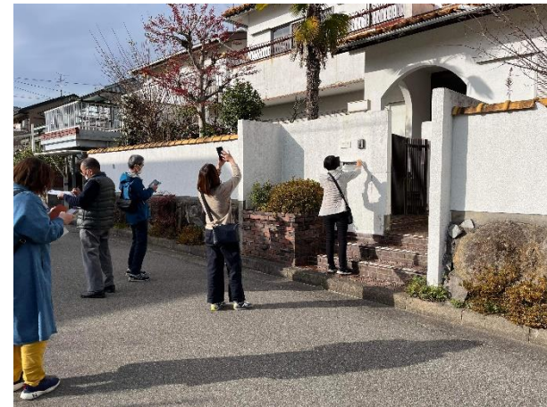
写真6.空き家調査デモ